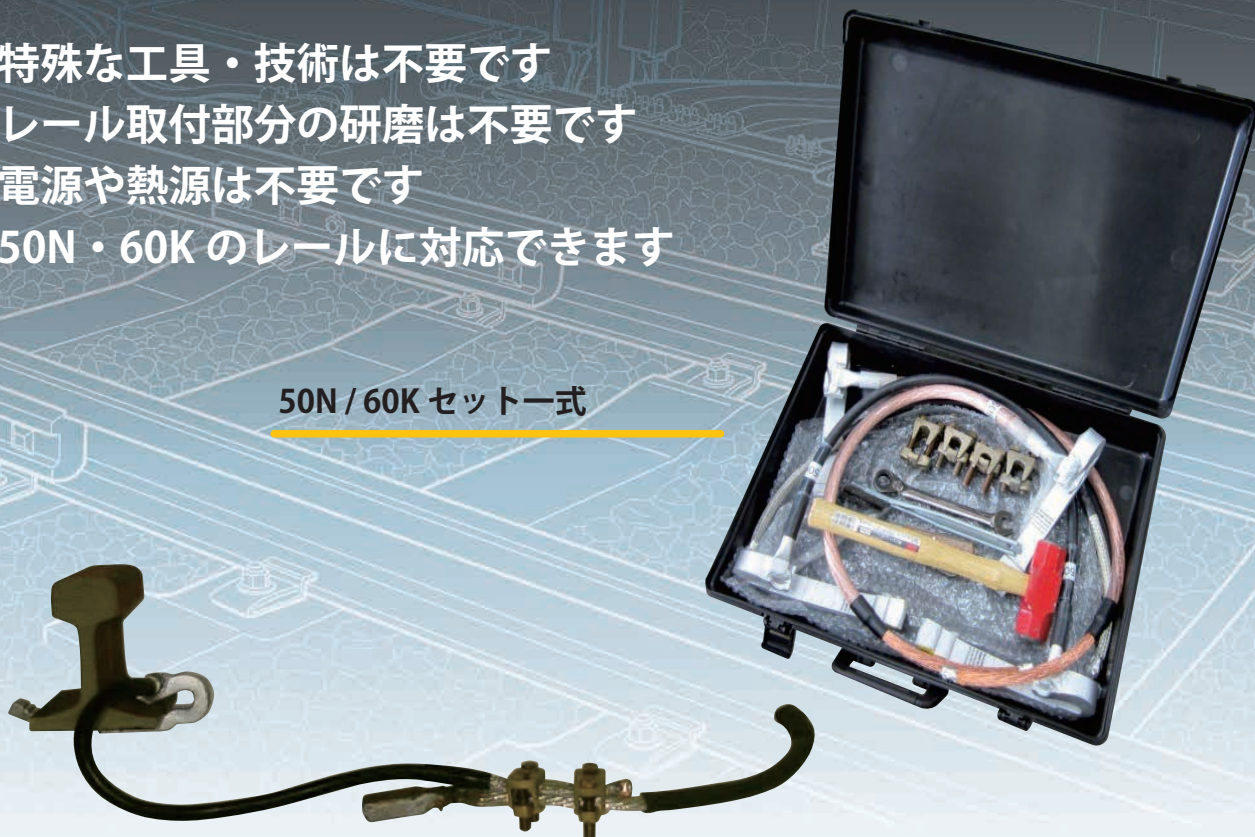
レール締結部とボンド線接続部