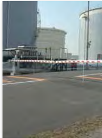
▲ センサー開閉式遮断機