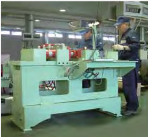
▲ ロッドオフセット加工機

従来の人の手による作業から、安全で高効率 な機器の開発が求められるようになりました。 当社ではこうしたニーズをモノづくりの重要 な役割と捉え、さまざまな省力機器の開発と 快適な社会環境の創造につとめています。